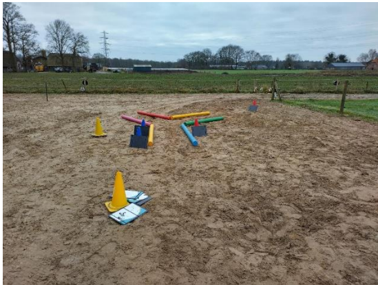
Afbeelding 3. Y-splitsing

Een voorbeeld van hoe dit in de praktijk toegepast kan worden is het uitzetten van een Y-splitsing die de persoon in kwestie samen met het paard kan gaan bewandelen (afbeelding 3). Aan de ene kant kan men de richting van het pad die men op wil gaan (doel, bepaalde normen en waarden, etc.) met diverse obstakels belemmeren. De andere kant staat bijvoorbeeld voor de weg die iemand op de meer “automatische piloot” bewandelt, mogelijkerwijs vanwege diverse redenen waarbij er minder weerstand wordt ervaren.